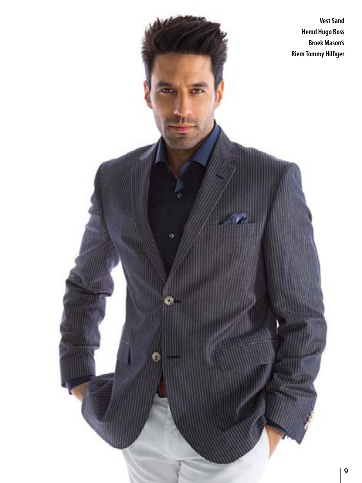
Vest Sand Hemd Hugo Boss Broek Mason's Riem Tommy Hilfiger