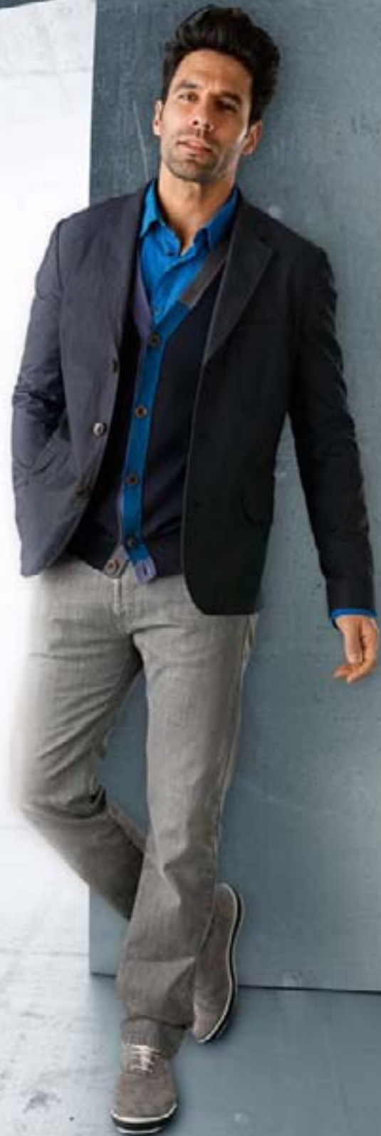
Vest & Pull Paul Smith Hemd Essentiel Jeans Armani Jeans Schoenen Floris van Bommel