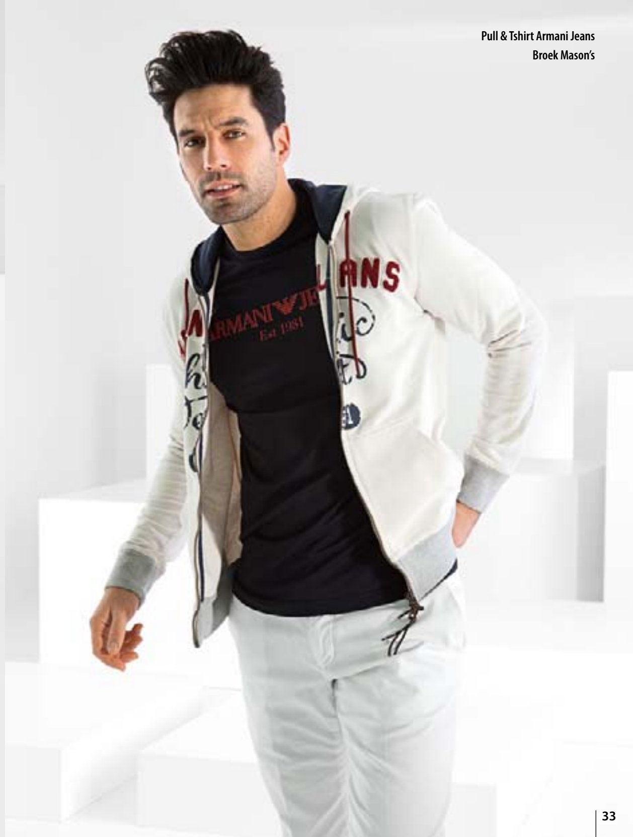
Pull & Tshirt Armani Jeans Broek Mason's